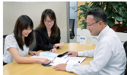
お客さまの就労や業務改善に役立つよう、データの活用アイデアを出し合ったりテキスト分析の切り口を共有したりと、日々分析精度を高めている。

自社の就労や業務の改善にあたって、課題の抽出や解決にお悩みの企業さまはお気軽にお問い合わせください。