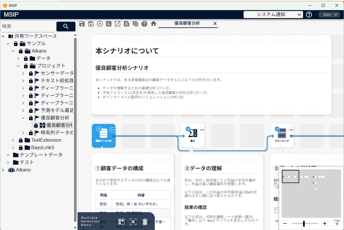
デスクトップアプリの画面例

個人利用に適した利用形態（デスクトップアプリ）を選択できるようになり、利用するときだけ起動できるようになりました。また同時処理可能なジョブ数や並列実行数といったパフォーマンス設定がGUIで設定できるようになりました。