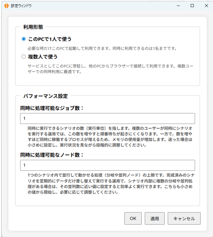
利用形態の設定画面例