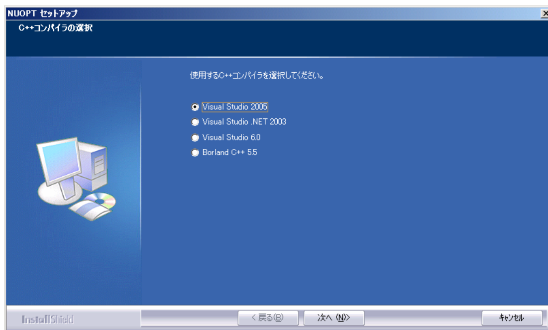
図 1 インストール時のコンパイラ指定画面

NUOPT が使用しているコンパイラの種類とは、NUOPT のインストール時に指定したコンパイラのことです。インストール時に次の画面(図 1)で指定したものです。