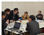
ワークショップ(各グループ)

ワークショップやテスト等から得られるインサイトを最大化させる狙いで、参加者の全発言の「テキストデータ化」→「テキストマイニング分析」→「特徴的なことばやことば同士の相関性等の見える化」を行いました。これにより、インサイトの顕在化の効率を高めることができます。